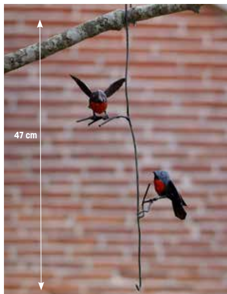
Réf. 2925 Couple de rouge-gorge à suspendre en métal 24,80 €

Ces oiseaux surprenants sont décoratifs mais aussi pratiques puisque deux disposent d'un petit crochet pour suspendre une boule de graisse, le troisième sert de tuteur et de mangeoire pour les oiseaux.