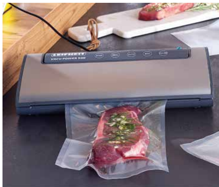
Réf. 2892 Machine sous vide 146,80 €